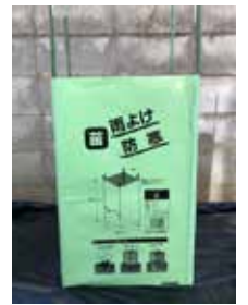
③見栄え良く整え、完成です。