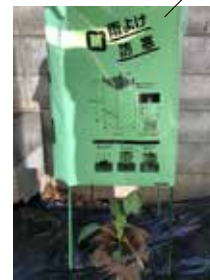
②苗シートカバーを支柱に被せます。