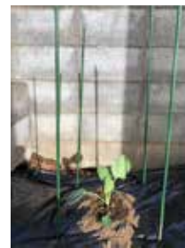
①植え付けた苗の回りに支柱を差し込みます。